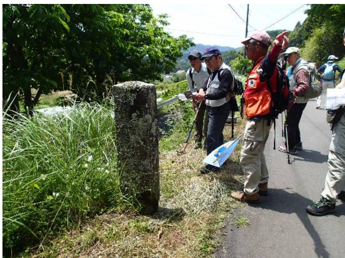
江戸時代に建てられた道標を見る (右 下川津東うら道 左 三しま)

薄日が差すウオーキング日和に恵まれ9時35分スタートする。小鍋口(旧下田街道)からは急な登り坂である。木漏れ日が差す杉林、桧林の茂る山道を進む。地藏、普門院分岐道標と落ち葉の道を進み10時25分峠に着く。小鍋峠には地藏、題目塔、歌碑が昔を偲ぼせる。小休止をして落ち葉の山道を下る。子安地藏、道標(右 下川津東うら道 左 三しま)と進み北の沢橋に11時20分に着く。伊澤政一郎監事の好意で須原区民館広場で昼食とする。12時30分ゴールに向かって出発。上原美術館、荒増では清水会員より茶々丸の墓、深根城跡の説明を聞き稲生沢川の右岸から伊豆急稲窪駅(11Km ゴール 1名)お吉が淵で小休止、伊豆急蓮台寺駅(15Km ゴール 7名)反射炉跡、伊豆の踊子の宿「甲州屋」と進み、ゴールの「別れの汽船のり場跡」に15時30分 11名でゴールする。