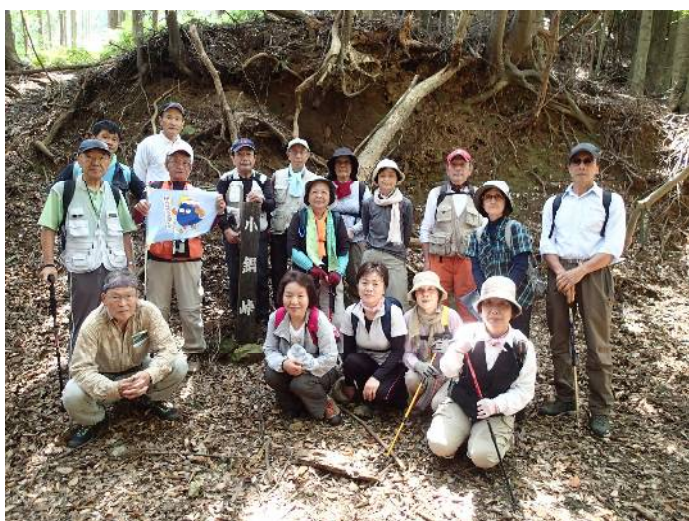
小鍋峠で参加者記念撮影