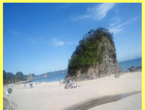
風光明媚な吉佐美大浜☆