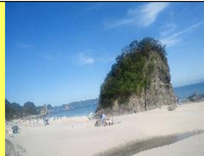
風光明媚な吉佐美大浜☆