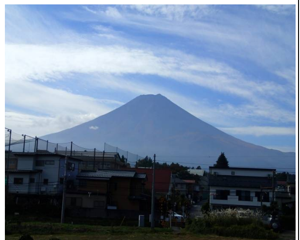
（初冠雪を見ることができませんでした。）

北口本宮浅間神社を出発して、なだらかな参道を下りていく。坂の左右にはかつて、御師（おし）の家が建ち並んでいた。御師とは、富士山をめざす信者に宿を提供し、祈りをあげる人のこと。明治以降は衰