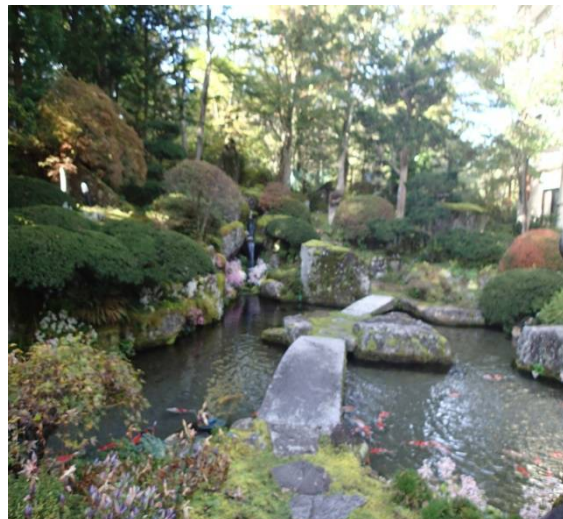
(庭園は鯉が泳ぎ、樹木は良く手入れされ、美しい庭園でした。)

宿の庭園と紅葉が素晴らしい、富士山は裾野から山頂まで望める。北口本宮富士浅間神社を 9 時 00 分スタートする。富士講信者の宿泊や食事の世話をした御師の住宅地を進み金鳥居を 9 時 30 分通過する。河口湖駅 10 時 25 分河口湖大橋 (500m) を渡り河口湖美術館前の広場で小休止 11 時 20 分、富士山はいつのまにか雲の中に隠れている湖畔の遊歩道を進み目的地の大石公園に 12 時 20 分ゴールする。