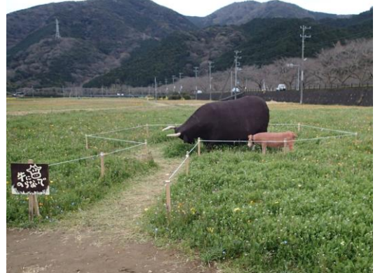
昨年のもやし畑の置物は牛の親子でした。今年は何か楽しみですね。

総延長 6Km にも及ぶ那賀川沿いに咲くソメイヨシノ桜の並木、国指定重要文化財の岩科小学校や松崎を代表する芸術のなまこ壁、水田の農閑期を利用した 58,000 平方メートルの花畑を楽しむコースです。