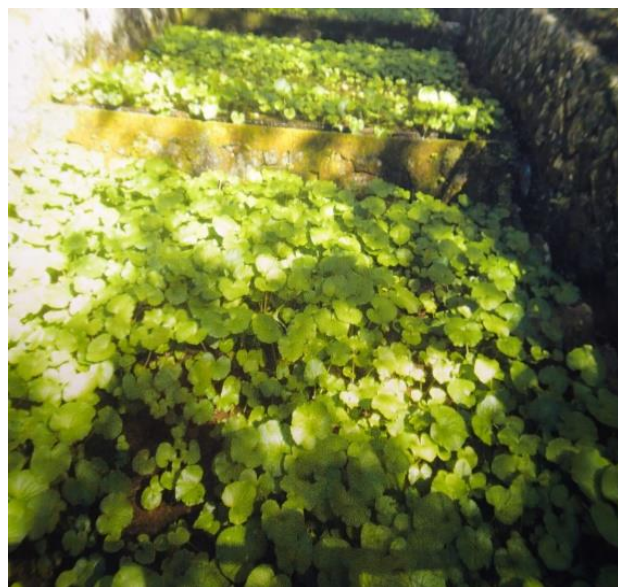
天城の清流で育てられているワサビ畑

女性軍団も美しい風景の道を365歩のマーチを合唱しながら峠を下っていた。伊豆で植林第1番目の、杉や檜木の並木、宗太郎林道を通り、先の東屋で昼食、好天で歩くと気持ちが良いが、日陰で休むと寒気が感じる。河津七滝は近日の降雨のせいか、水量が多く飛び散る飛沫による虹は美しく歓声が上がった。七滝を過ぎると、山や畑に色づいた見事な鈴なりの柿、梨本、大鍋の山を飾って見せていた。誰かが猿の上前を跳ね戴いたようで、渋いシブイと言っていた。旧下田街道で、今尚現役で頑張っているつり橋を渡った。この吊り橋も現在工事中の伊豆縦貫道によって、どう変わるのだろうか？旧下田街道のなごりをぜひ残してほしいものである。その工事によって、山側は迂回となっていて、小鍋神社方向は行けず、福田屋直行となった。下田街道は多くの人を歴史や時代を乗り越えて引きつける力を持っているコースだった。