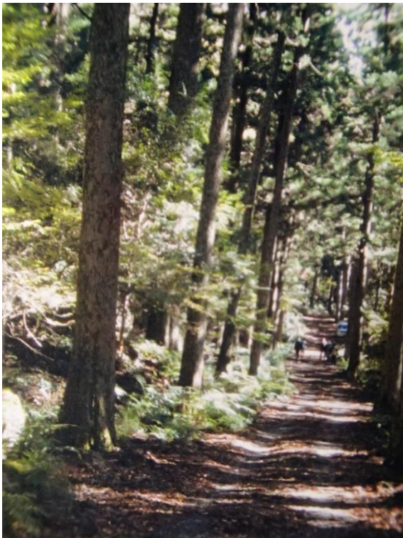
樹齢100年以上の杉並木の下を歩くのは気持ちがよい

好日和。我が倶楽部のシンボル女性のストレッチ体操で、これから旧下田街道を湯ヶ野福田屋に