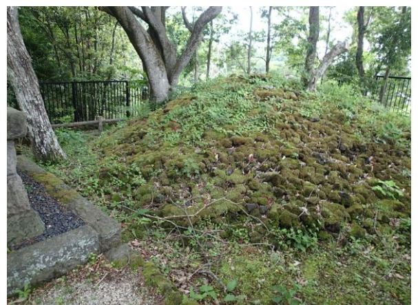
積み上がった小石に苔が訪れた人達の願いと時の流れを感じさせる。

まだ 6 月の初めだというのに、日本列島に台風が近づいてくるという天気予報だったのですが、朝方は雨が降る事もなく出発することが出来ました。別荘地として開発された伊豆高原の中には、東浦路の面影は少なく手入れをされた庭を眺めたり、おしゃれなホテルやランチの店を見つけては「今度来ようか！」などと、のん気に話しながら進んでいくと、今回最初の目的地“法華塚”に着きました。日蓮上人に“家内安全”“交通安全”“この例会が無事にゴールできますように”と祈りながら小石を積みました。