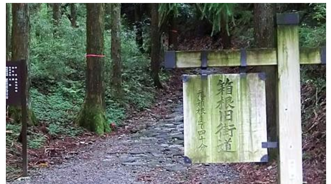
江戸時代の西国大名や朝鮮通信使など旅人がこの難所を越えた情景を偲ばせる石畳道