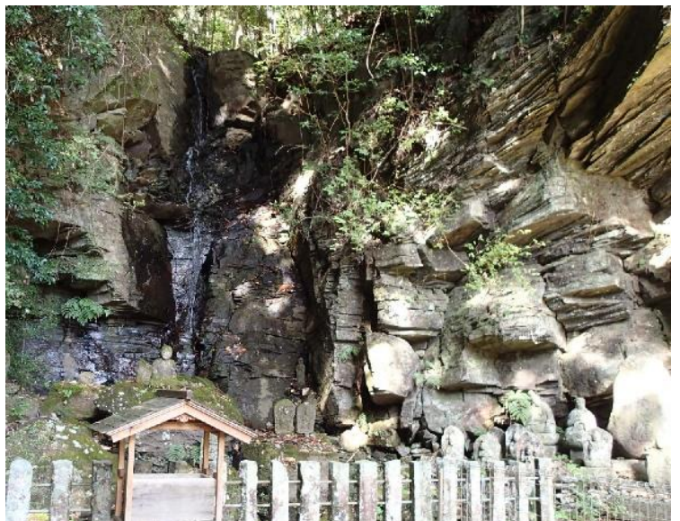
弘法大師修行の地（板状節理が美しい洞）

空は青く、歩き始めると少し汗ばむ身体を心地よく風が通り抜けてくれて……もみじは今まさに紅葉の盛りが始まったところ。これは、弘法大師様からのプレゼントだわ。ウオーキングを妨げるものは、何もない。ただひとつ心配なのは、最近よく“こむら返