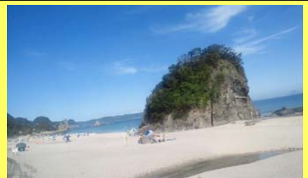
風光明媚な吉佐美大浜☆